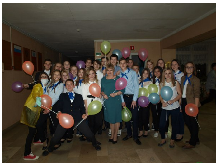
Люди нашего класса

С каждым годом мы становимся все старше и старше. И одним из этапов нашего взросления стало посвящение в старшекласники. Перед нами стояла непростая задача - отобразить наш социально-экономический профиль, с которой мы блестяще справились. Наше выступление получилось светлым, веселым и интересным, и оно нашло положительные отзывы от учащихся нашей школы и учителей. Особенно всех удивила задумка с деньгами, ведь она достаточно четко отображает будущее учеников социально-экономического профиля (возможное будущее, конечно). Я надеюсь, что нас всех ждет счастливое и успешное будущее. Ну а пока, нужно оправдать гордое звание "СТАРШЕКЛАСНИК".